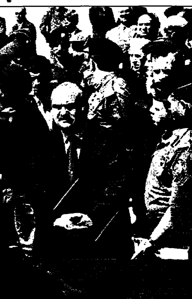
الأمير حسن ولي عهد الأردن يتلقى آية مسكية في معرض اسامة السلاح